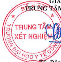
TS. Đặng Thế Hưng