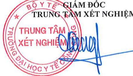
TS. Đặng Thế Hưng