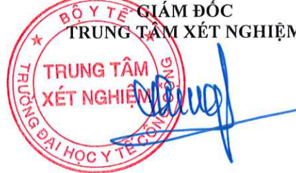
TS. Đặng Thế Hưng