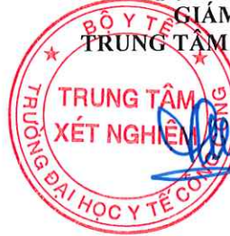
TS. Đặng Thế Hưng