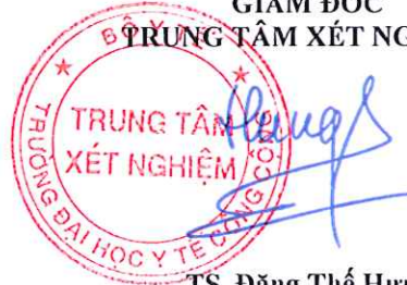
TS. Đặng Thế Hưng