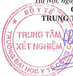
TS. Đặng Thế Hưng